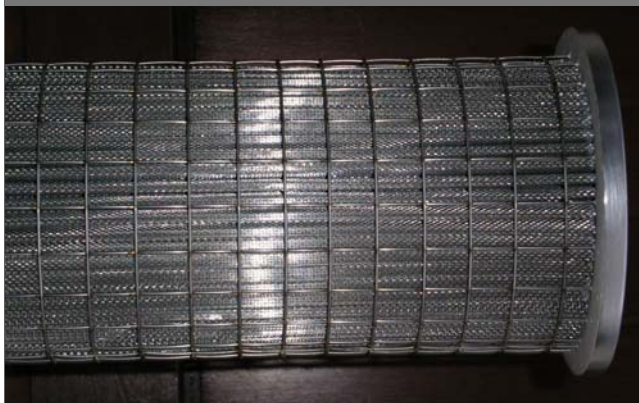
Köb Holzfeuerungen GmbH Flotzbachstraße 33, A-6922 Wolfurt/Vorarlberg